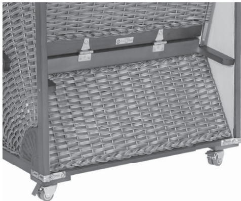
Nahaufnahme der verstellbaren Rückenlehne

Sie können die Lehne durch das Verstellen des Oberkorbs zur Liegefläche erweitern. Beachten Sie hierbei, dass der Oberkorb sehr schwer ist und nach hinten fallen kann.